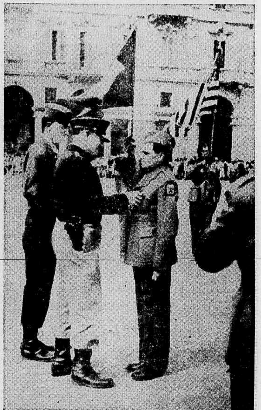
Tenente-Coronel condecorado na FEB

JORNAL DO BRASIL — Rio de Janeiro, quinta-feira, 20 de julho de 1967